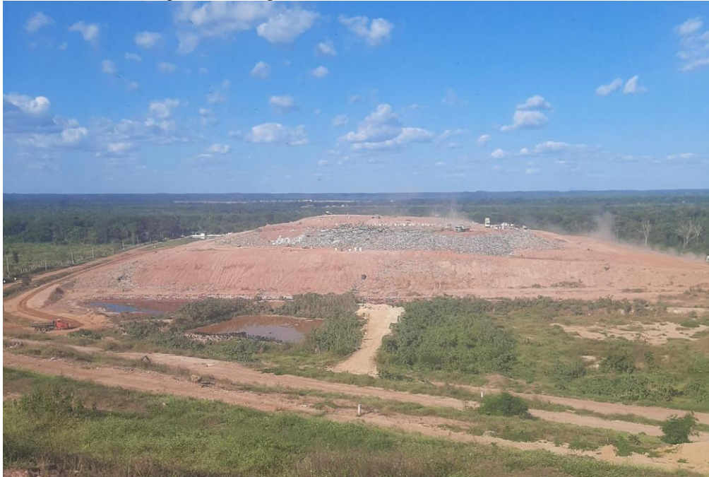
Figura 2: Vista geral da Célula II do Aterro de Teresina.

sustento para suas famílias. Apesar da instalação de cercas, da vigilância no portão de acesso e da presença de seis vigias distribuídos pela área, o controle do espaço não se mostra eficaz, dada a extensão territorial do local e a pressão socioeconômica que leva essas populações a ocupá-lo (BESEN et al., 2017; DIAS, 2016).