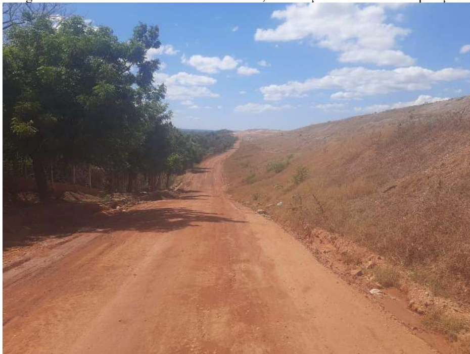
Figura 1: Via interna do Aterro de Teresina-PI, em direção às células de disposição.

Esse cenário evidencia um descompasso entre a estrutura disponível e a efetiva implementação de uma gestão integrada de resíduos, limitando o potencial de valorização material e energética e ampliando os impactos ambientais e sociais do aterro de Teresina.