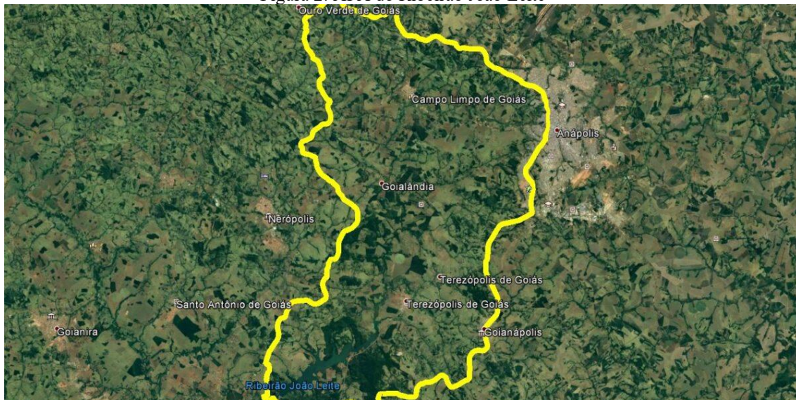
Figura 2: APA do Ribeirão João Leite

A importância do componente João Leite reforça esse desenho. Como mostra a Figura 3, a Área de Proteção Ambiental do Ribeirão João Leite, criada pelos Decretos Estaduais n. 5.704/2002 e 5.845/2003, cobre aproximadamente 72.128 hectares distribuídos em sete municípios e inclui zonas de proteção específicas, além de dois parques estaduais (Rios et al., 2013).