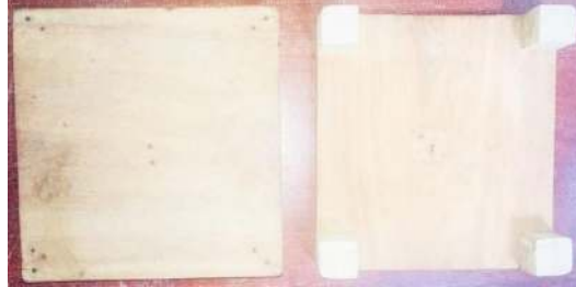
Figura 4 - Plataformas para transferência lateral