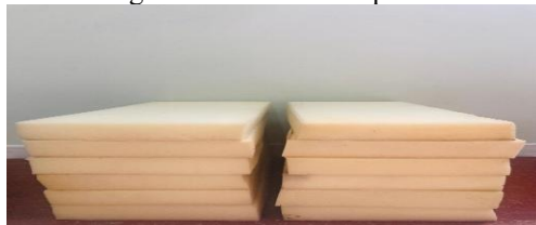
Figura 2 - Blocos de espumas