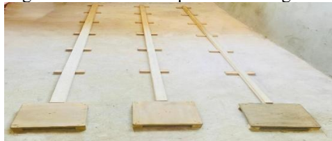
Figura 1 – Traves de equilíbrio a retaguarda.