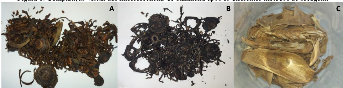
Figura 1: Comparação visual das inflorescências de bananeira após os diferentes métodos de secagem.

Legenda: A – Amostra seca em air fryer ; B – Amostra seca por liofilização; C – Amostra seca em forno convencional.