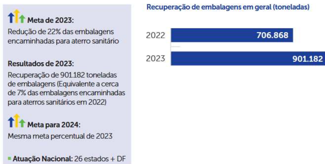
Figura 2. Situação do Sistema de Logística reserva de embalagens em geral no Brasil.