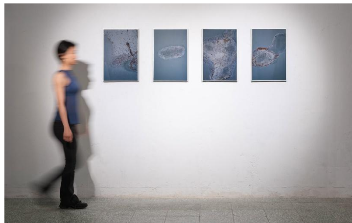
Lingering State I-IV, 2025