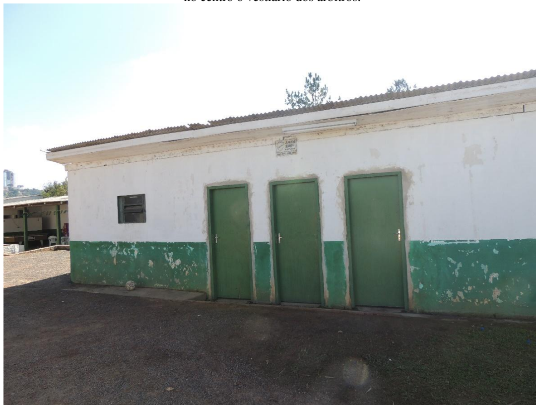
Fotografia 4 - Vestiários do Mirante Esporte Clube. A direita o espaço destinado ao clube, a esquerda para os visitantes e no centro o vestiário dos árbitros.