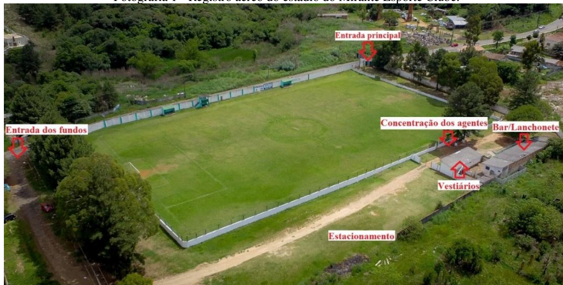
Fotografia 1 - Registro aéreo do estádio do Mirante Esporte Clube.

Estas fontes de renda juntas, somadas a alguma doação, por parte de agentes que possuíam laços de afetividade com o clube, possibilitavam o pagamento do salário de um caseiro, contas de água e luz, manutenção do campo e em parte, os gastos com arbitragem, taxa de inscrição nos campeonatos e de filiação a Liga. Como os valores financeiros nem sempre eram suficientes, comumente o clube realizava almoços, com a venda de ingressos ou rifas para arrecadação de fundos para reformas ou reparos na estrutura física do local.