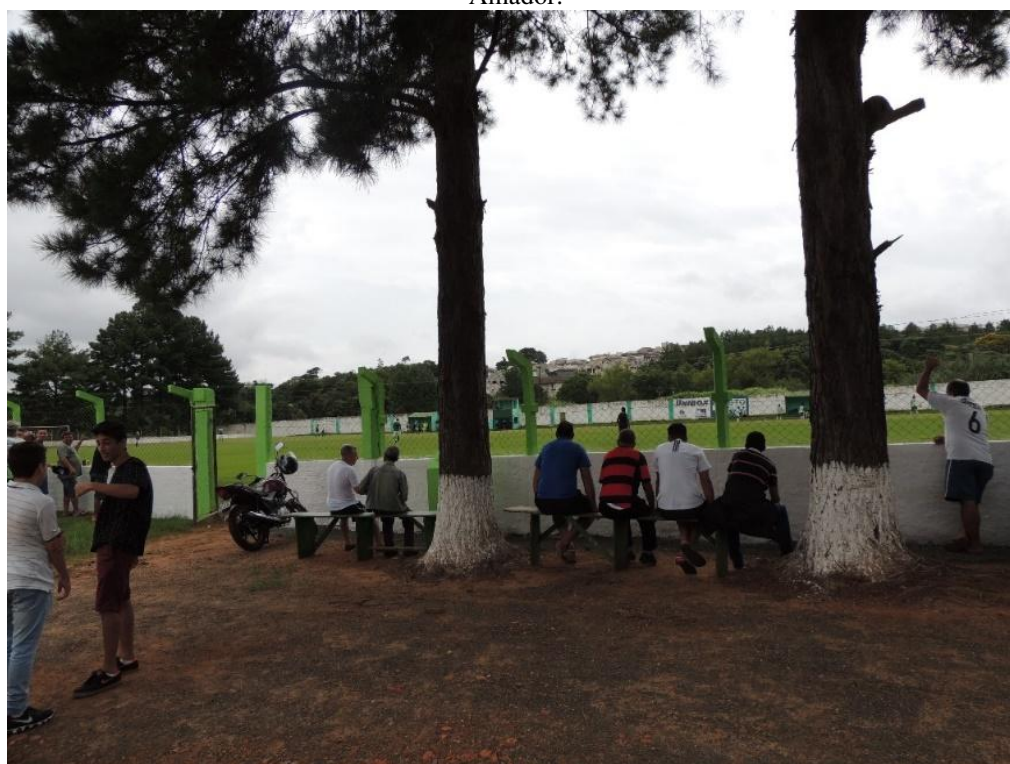
Fotografia 2 - Veteranos e torcedores do Mirante Esporte Clube aguardando o início do jogo válido pelo Campeonato Amador.