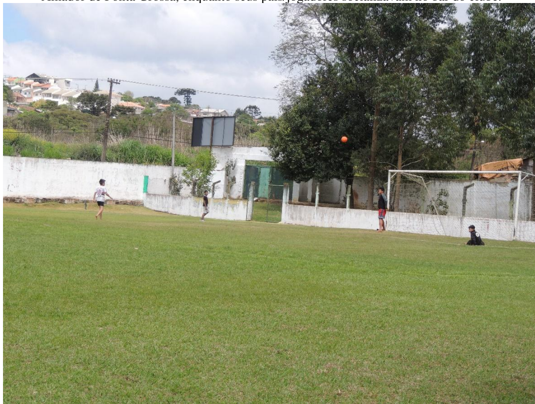
Fotografia 3 - Meninos jogando futebol após o término de uma partida do Mirante Esporte Clube, no Campeonato Amador de Ponta Grossa, enquanto seus pais/jogadores socializavam no bar do clube.