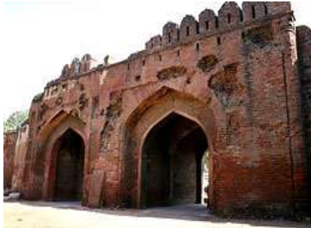
Figura 4 – Portão Caxemiri, em Delhi

Construído em 1835, era o início de uma estrada que conectava Delhi com a Caxemira. foi palco de duros confrontos na rebelião de 1857, donde os seus danos.