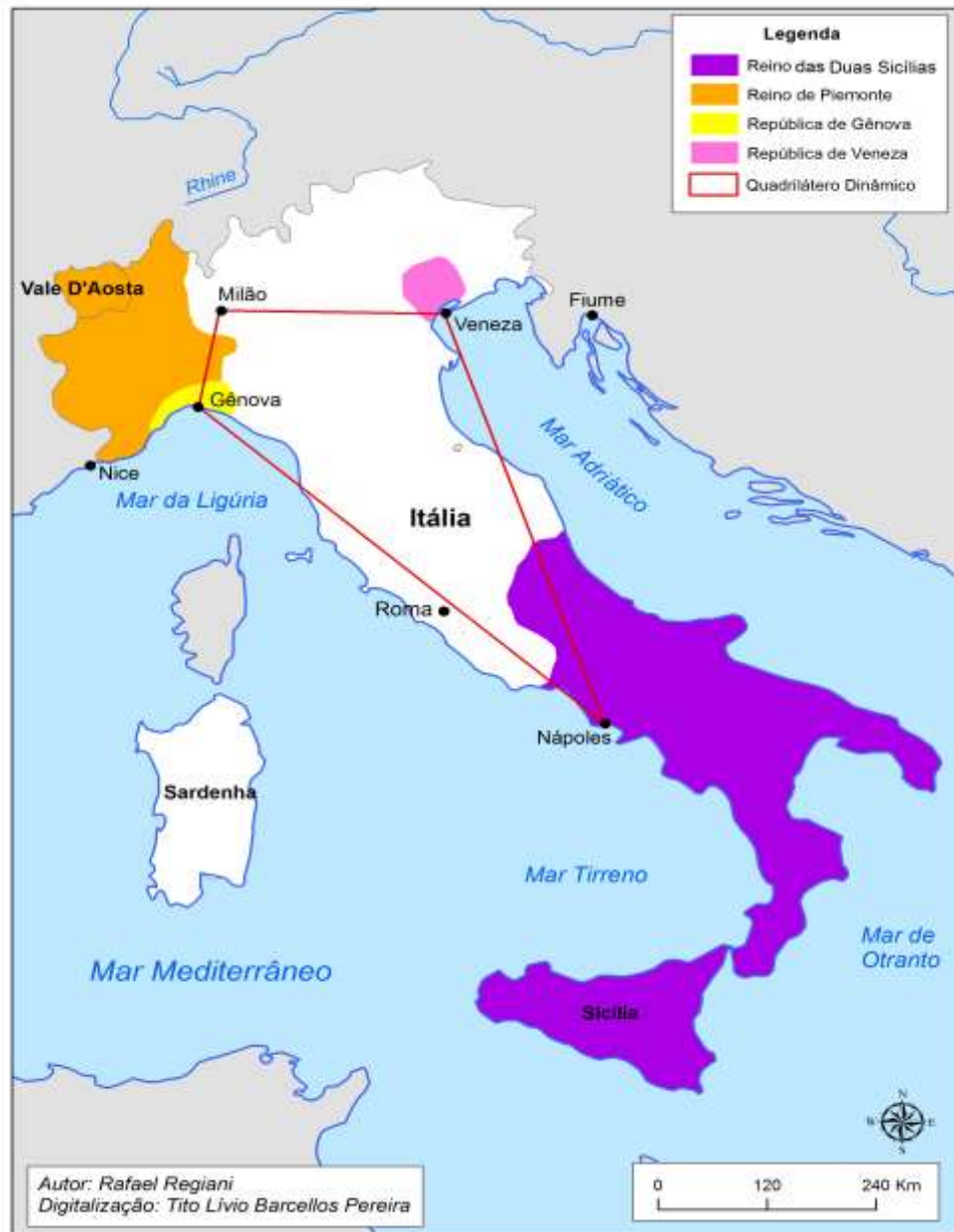
Figura 3 – Mapa político-histórico da Itália

Esse ponto de vista também era defendido por Karl Marx (1853, n.d.), que enxergava a Índia como a geografia da Itália mais as relações sociais da Irlanda: