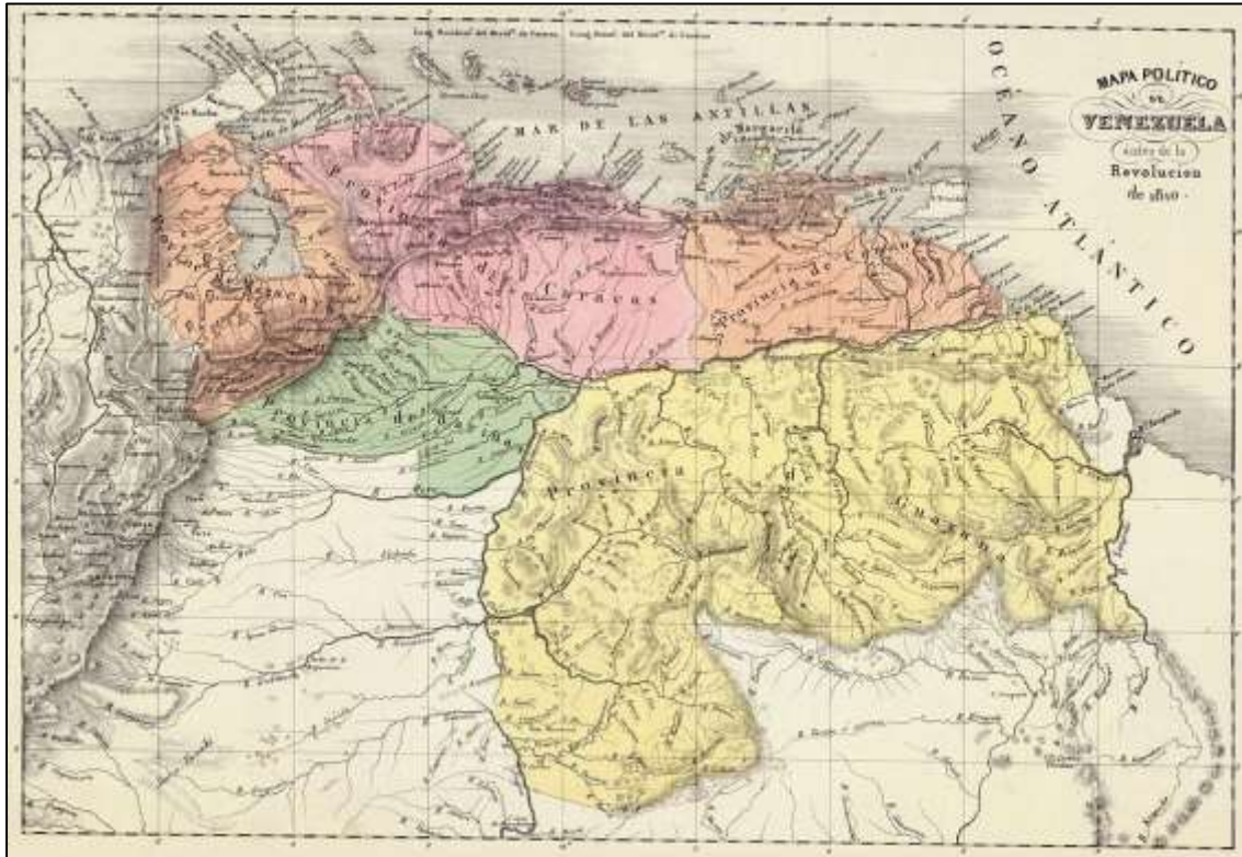
Figura N° 2- Mapa de la Capitanía General de Venezuela.

De igual manera se han usado como evidencias demostrativas de estas posesiones algunos acuerdos bilaterales del siglo XIX tales como, el Tratado de Cooperación y Amistad firmado entre la Gran Colombia y Gran Bretaña (1825) y posteriormente, separada Venezuela de la Gran Colombia, la Convención firmada entre este nascente Estado y el Reino Unido en 1834 donde quedó implícito la aceptación de su nueva condición autónoma y soberana; en ninguno de estos casos Gran Bretaña cuestionó los límites venezolanos ni reclamó territorio alguno de su pertenencia. Diez (10) años después se firmó el Tratado de Paz y amistad entre Venezuela y España (1845), con lo cual la Corona Hispana "...renuncia por sí, sus herederos y sucesores, la soberanía, derechos y acciones que le corresponden sobre el territorio americano conocido bajo el nombre de Capitanía General de Venezuela, hoy República de Venezuela". A pesar de estas favorables decisiones, en la cuarta década del siglo XIX se originó abiertamente el conflicto limítrofe,