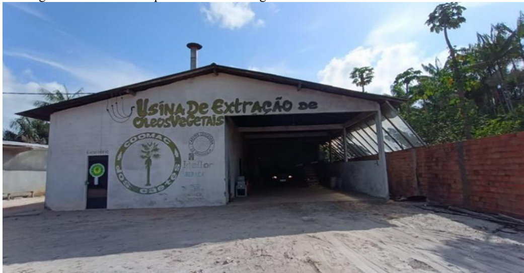
Figura 2 – Sede da Cooperativa Mista de Agricultores Familiares Extrativista dos Caetés