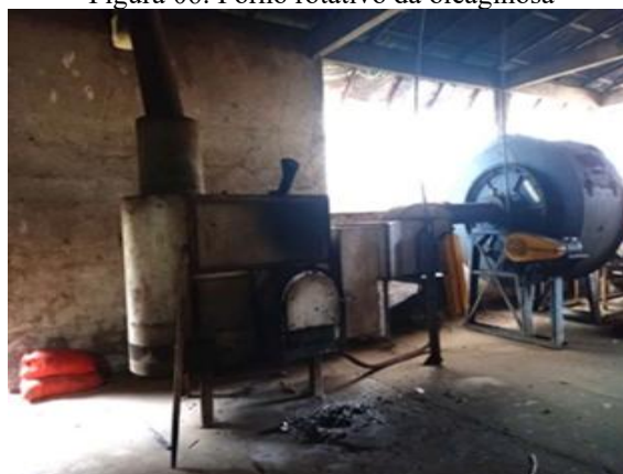
Figura 06: Forno rotativo da oleaginosa