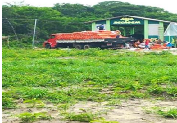
Figura04: Chegada das sacas da oleaginosa tucumã na Coomac