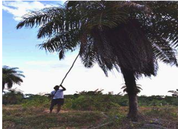
Figura 03: O extrativista coletando a oleaginosa tucumã de forma sustentável