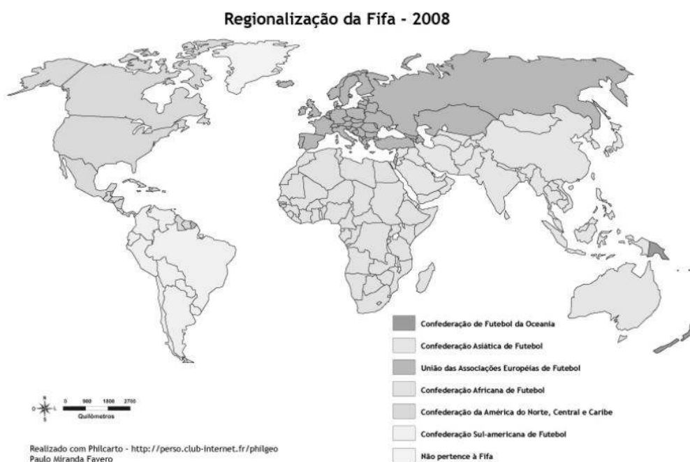
Figura 2: As Confederações de Futebol.

Considerando a Figura 2, das Confederações de Futebol associadas a FIFA ( Fédération Internationale de Football Association ), observa-se a grande semelhança da regionalização empregada com a divisão mundial civilizacional de Huntington. Assim, podemos afirmar que a FIFA é uma instituição geopolítica. Em comparação, a Organização das Nações Unidas (ONU) possui 192 filiados, menos que a FIFA, que atua em 208 países (FAVERO, 2009).