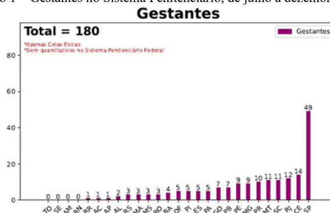
Gráfico 1 – Gestantes no Sistema Penitenciário, de julho à dezembro de 2024.

Com a entrada em vigor da Lei nº 12.714/2012, foi instituído o Sistema de Informações do Departamento Penitenciário Nacional (SISDEPEN), criado com o objetivo de atender às determinações legais relativas à organização e ao acompanhamento do sistema prisional brasileiro. Esse mecanismo consolidou-se como ferramenta essencial para a gestão penitenciária, ao centralizar informações sobre as unidades prisionais e a população privada de liberdade. Sua implementação representou um avanço significativo na sistematização dos dados, promovendo maior transparência, controle estatal e subsidiando a formulação de políticas públicas mais eficazes.