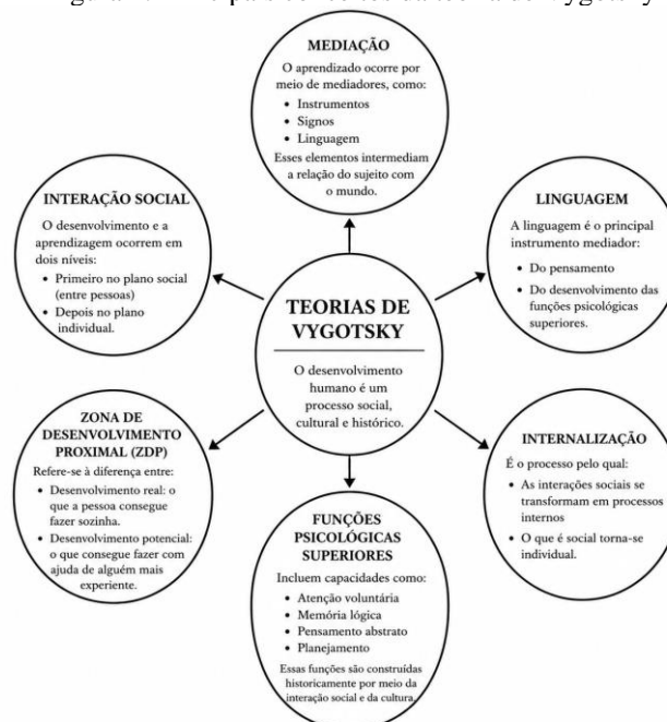
Figura 2: Principais conceitos da teoria de Vygotsky