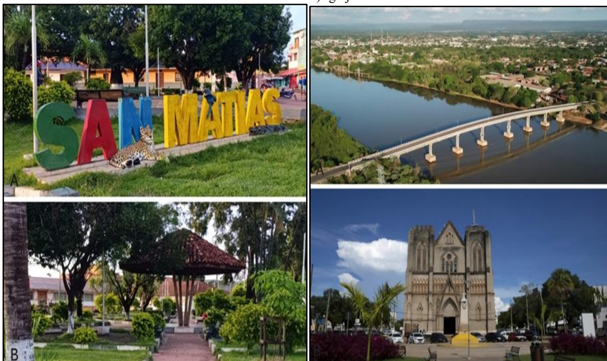
Figura 1 – Cidade de San Matías, Bolívia. A e B) Praça German Bush e Cidade de Cáceres em Mato Grosso. A) Ponte Marechal Rondon. B) Igreja São Luiz