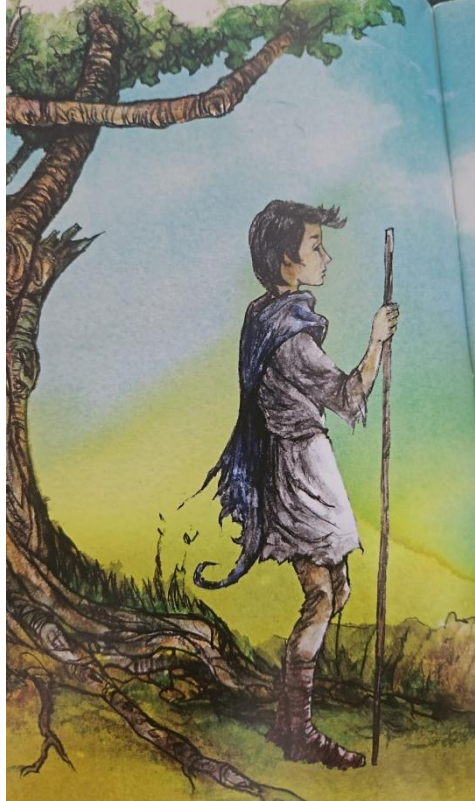
Figura 2: Ilustração Rogério Borges - Emmi