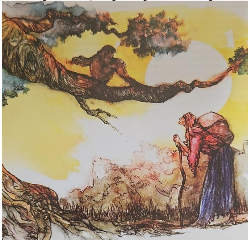
Figura 3: Ilustração Rogério Borges - A velha mendiga