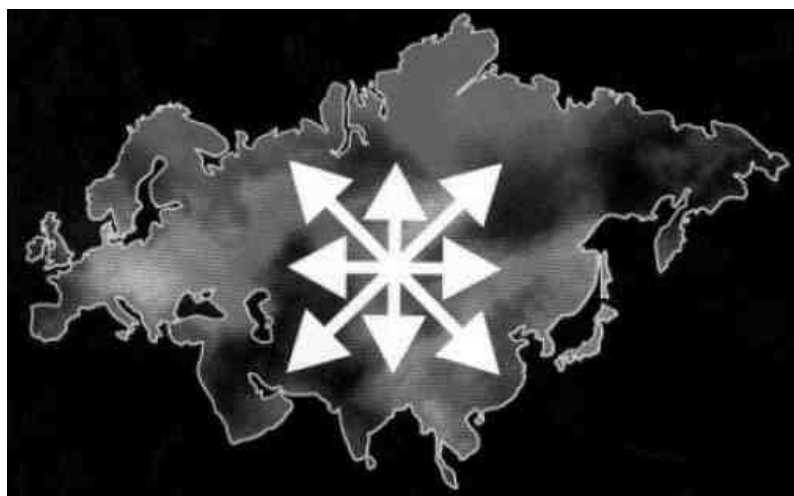
Figura 1 – Do coração da Rússia para o mundo

O eurasianismo pretende em primeiro lugar, ser uma alternativa a globalização. Dugin entende o modelo de globalização atual como a representação do expansionismo dos EUA e seus aliados da OTAN, ou seja, como a representação de um mundo unipolar que tem nos estadunidenses seu modelo econômico e filosófico e que quer impor ao mundo seus valores liberais, individualistas e democráticos.