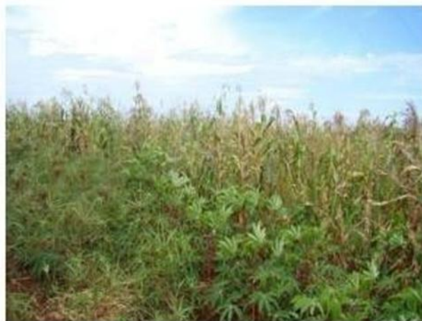
Figura 1 - Sistema produtivo consorciado de mandioca e milho

Embora os guaranis se valham da caça e da pesca, a base de seu sustento é fornecida pela agricultura. O cultivo do milho é de suma importância, comparado aos demais vegetais. O milho possui um significado importante para o povo guarani. Na comunidade Toldo Guarani são cultivados vários tipos de milho: o tradicional; o milho cateto, chamado de avaxi ete'í (milho verdadeiro); e, no sistema de monocultivo é plantado milho duro, obtido através de sementes compradas para os sistemas produtivos – esse é conhecido como avaxi (milho falso), o qual algumas famílias optam por não cultivar (imagem 01).