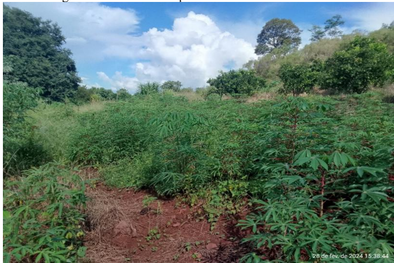
Figura 4- Área de Produção de Alimentos de Subsistência

A produção de subsistência ainda resiste na comunidade. Realizada em uma área de, aproximadamente, 06 hectares, os guaranis produzem diversos alimentos para consumo próprio, como milho tradicional, a batata-doce, o amendoim, a mandioca e o feijão, utilizando técnicas de adubação orgânica, aração do solo e manejos mais intensivos em mão de obra (imagem 4).