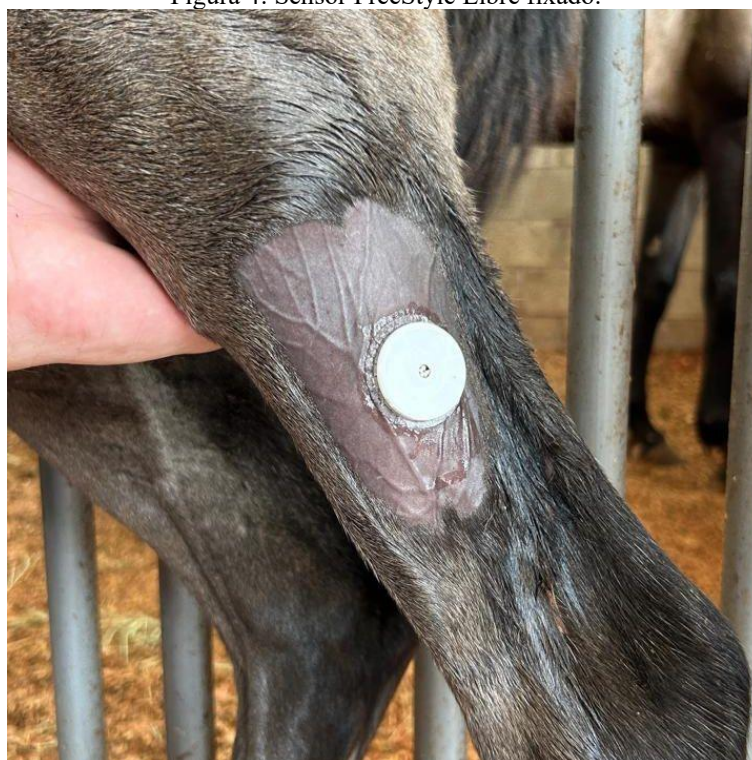
Figura 4: Sensor FreeStyle Libre fixado.