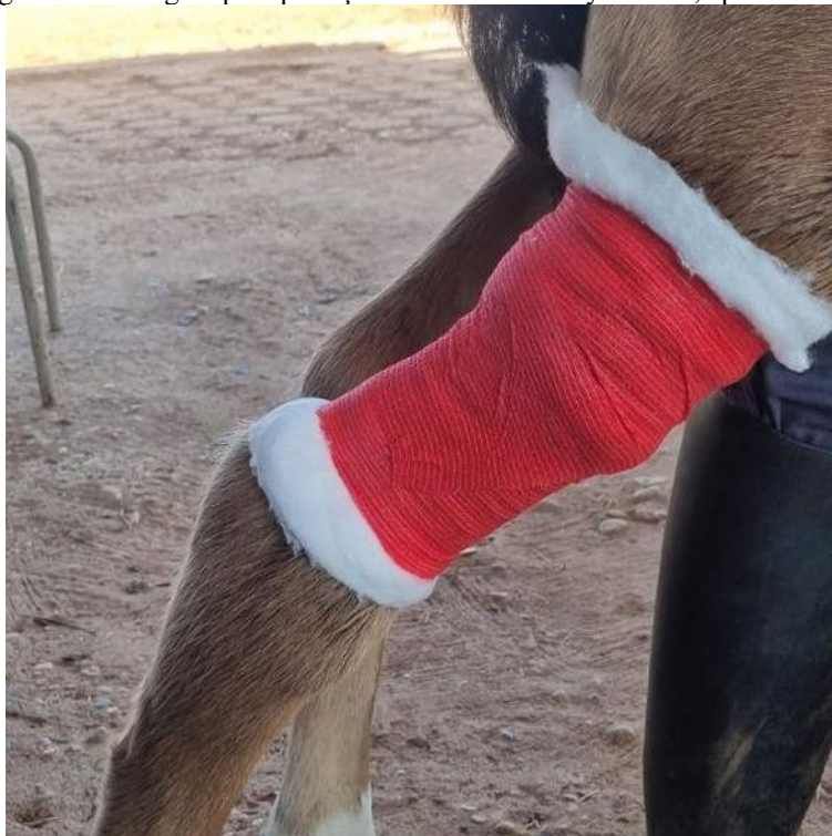
Figura 2: Bandagem para proteção do sensor FreeStyle Libre, após inseri-lo.