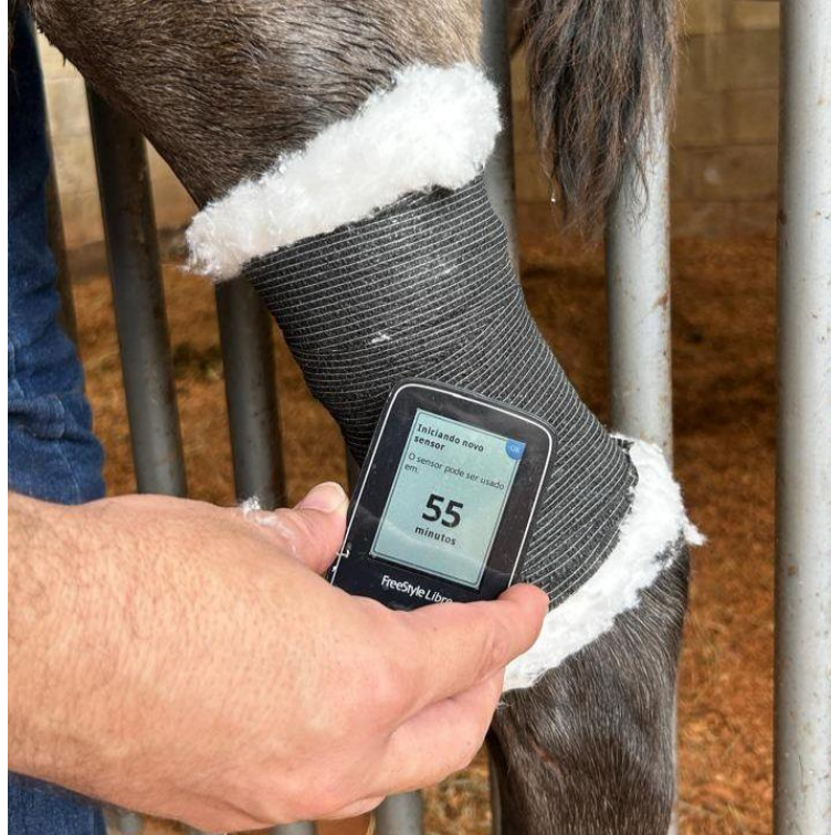
Figura 5: Leitor aguardando o período de calibração das leituras do sensor FreeStyle Libre.