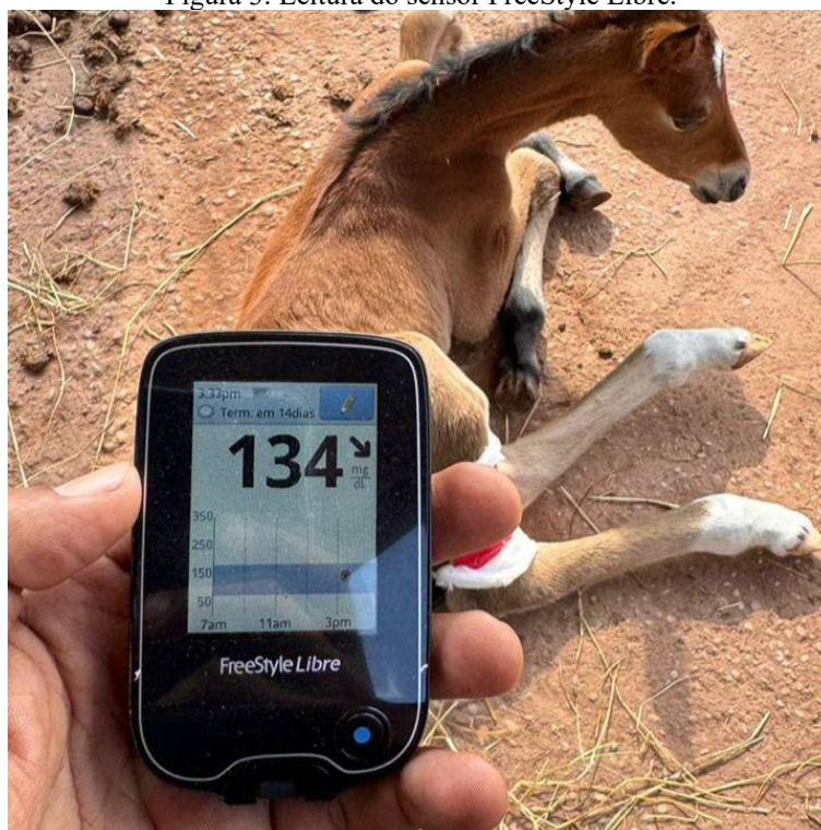
Figura 3: Leitura do sensor FreeStyle Libre.