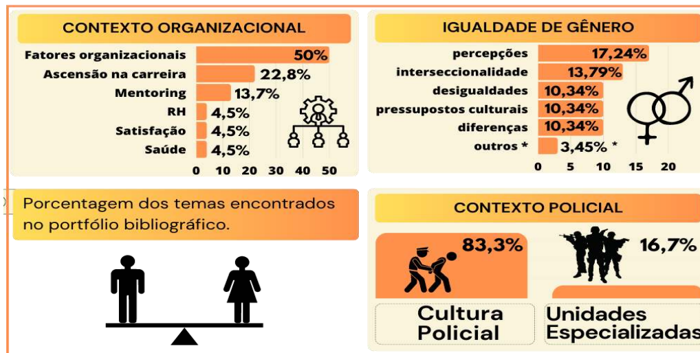
Figura 2 - Diagnóstico do Portfólio Bibliográfico

Para a realização da Análise Sistemática 52 artigos que mencionaram sugestões para trabalhos futuros foram utilizados, onde os resultados se encontram sintetizados na Figura 2 a seguir.