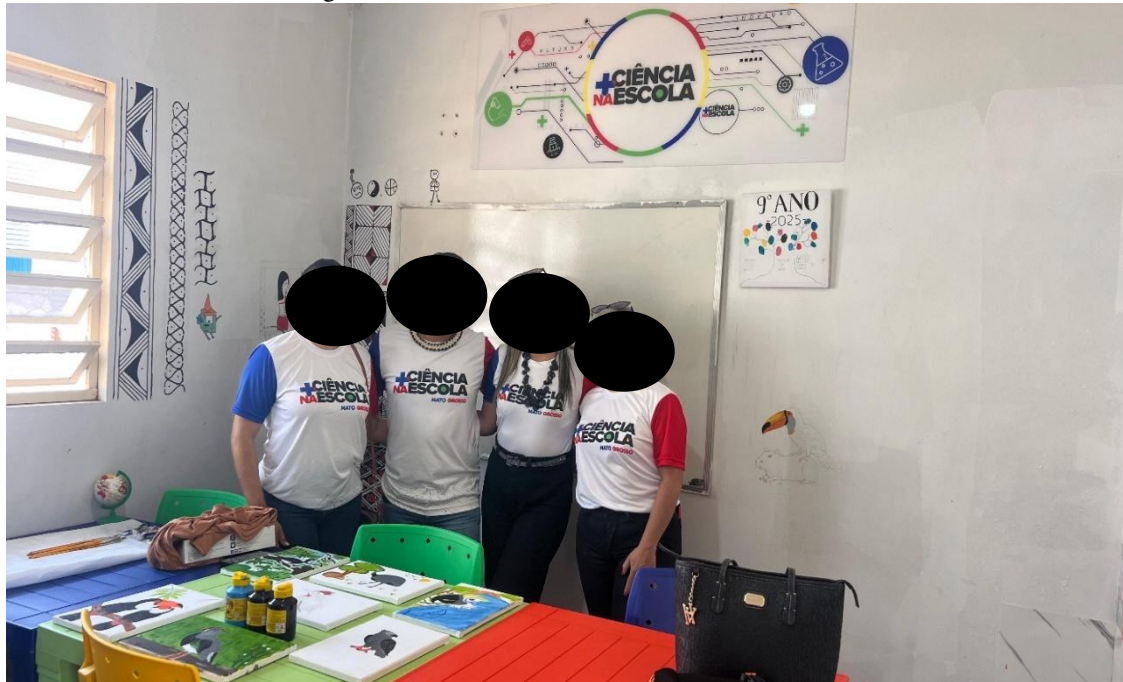
Figura 3 – Laboratório Maker da Escola Julá Pará

Durante a visita, observou-se o funcionamento do Laboratório Maker, um espaço de inovação criado em parceria com o Projeto Mais Ciência na Escola . Esse laboratório permite que os estudantes aprendam ciências, robótica e matemática a partir de materiais recicláveis e situações do cotidiano.