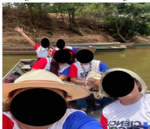
Figura 1: Travessia do Rio Paraguai

O percurso até a aldeia começou pela travessia do Rio Paraguai, realizada em barco, sob orientação de membros da comunidade indígena. Esse momento, descrito por muitos participantes como um “ritual de passagem”, marcou o início de um deslocamento não apenas geográfico, mas também simbólico e epistemológico.