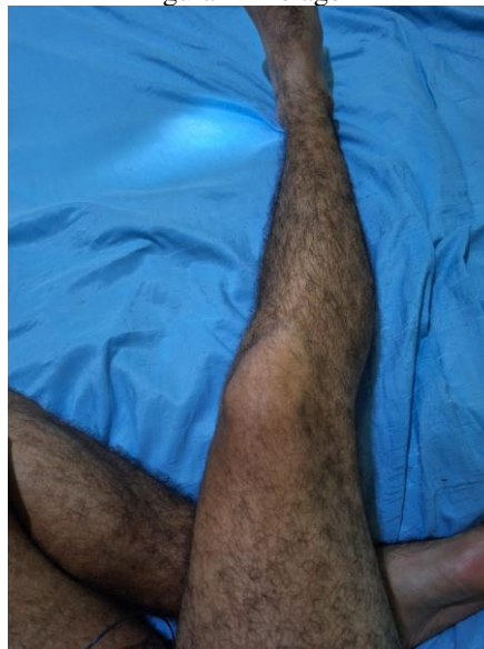
Figura 2 - Pelagem