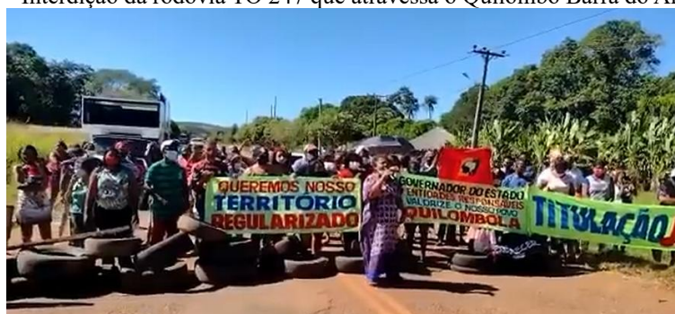
Figura 2 – Interdição da rodovia TO 247 que atravessa o Quilombo Barra do Aroeira, TO.

Atualmente, conforme Alves (2021), a comunidade quilombola da Barra da Aroeira mantém uma luta participativa e contínua pela regularização de seu território. Diante da ausência de avanços em suas demandas, seus membros têm mobilizado estratégias de resistência e fortalecimento da organização coletiva, com o objetivo de sensibilizar as autoridades para uma problemática histórica vivenciada há muitos anos. Um exemplo dessa mobilização é o ato de interdição da rodovia TO 247, refletindo o histórico de resistência das populações negras, especialmente em estados como o Tocantins, marcados pela expansão do agronegócio e a exploração das terras para a pecuária e a agricultura de soja, destacando-se como um exemplo de organização e resistência no cenário nacional.