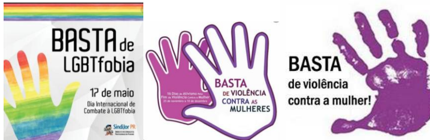
Figura 2. Campanha Basta de LGBTfobia/ Basta de violência contra mulheres

Essa imagem da “mão aberta”, da mão em “posição de basta” não circula apenas em relação a violência contra a mulher, mas, basicamente, contra as minorias políticas, como grupos LGBTQIAPN+ e a comunidade/povos negros/pretos, idosos, crianças e adolescentes, vemos nessas outras imagens, que ao invés da mira apontada para o centro da mão, temos outros significantes, no caso dos grupos LGBTQIAPN+ encontramos ao centro da mão a bandeira com as cores do arco-íris, ou a imagem de um coração colorido. As cores como importantes significantes variam de grupos para grupos, em tempo que ao centro da imagem da mão na campanha LGBTQIAPN+ são as cores do arco-íris (que em primeira análise a diversidade de cores significa a diversidade de pessoas e gêneros), no caso das campanhas que enfocam as mulheres além do preto e branco, preto e vermelho é comum encontrar a cor lilás que alude a luta do movimento feminista, como nas imagens abaixo: