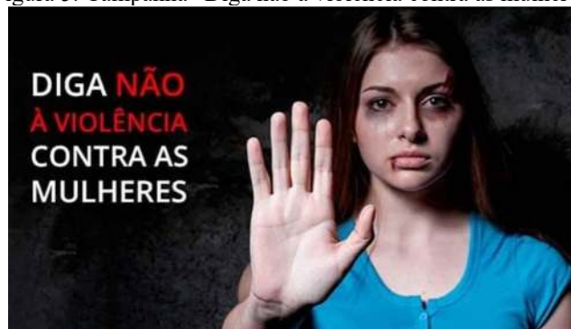
Figura 5. Campanha “Diga não a violência contra as mulheres”